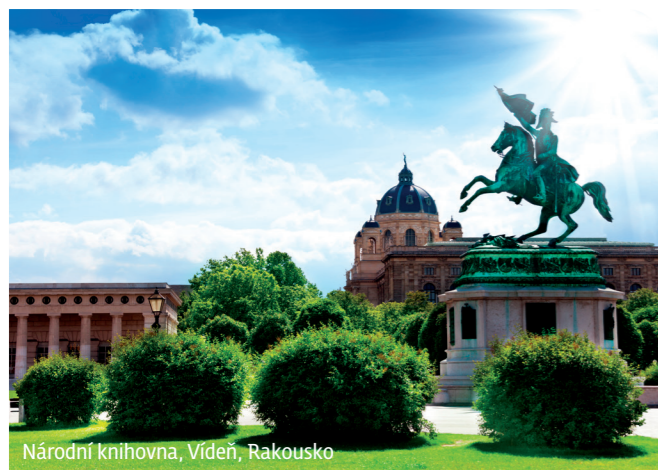
Národní knihovna, Vídeň, Rakousko