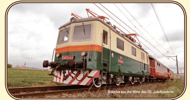
Bobinka aus der Mitte des 20. Jahrhunderts