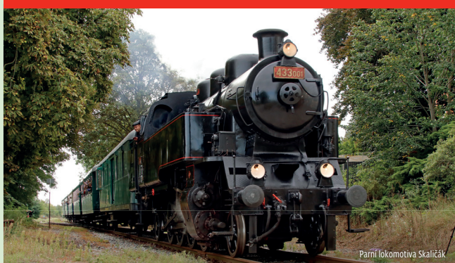
Parní lokomotiva Skalciák