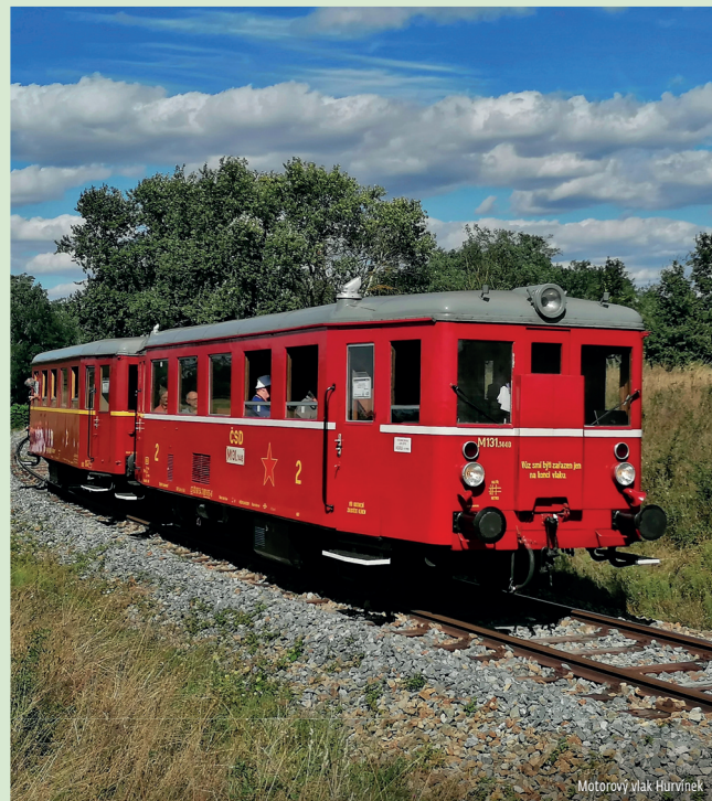
Motorový vlak Hurvínek